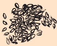
British Grown Linseed