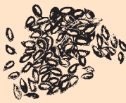
British Grown Linseed