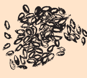
British Grown Linseed